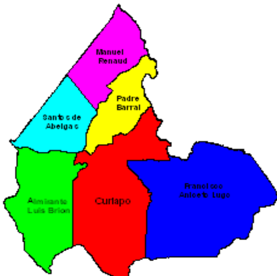
Figura 1. Ubicación de la Parroquia Manuel Renaud en el Municipio Antonio Díaz del estado Delta Amacuro